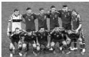
西班牙队能否打破欧洲杯史上最大魔咒吗?