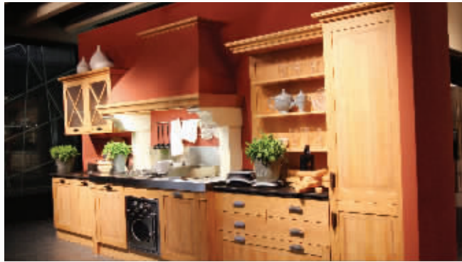
开来推出的斯图加特特价橱柜

相关专家表示,网购有风险,购物需谨慎。第一,资金风险。如上所述,家装建材类消费具有金额大的特点,一个订单少则几百元,多则成千上万元,通过网络打款的资金风险不言而喻;第二,产品风险。通俗地说,家具建材这样的“大件”,往往在网络上看到的都是漂漂亮亮的图片,但真正到发货环节,还是从经销商或者厂家出,“货不对版”的风险很大,而“货不对版”一旦发生,后期维权成本也相当高,要么费钱,要么费时间。第三,时间成本高。很多热衷网购的消费者自以为占了价格的便宜,殊不知在浩繁的网络海洋里