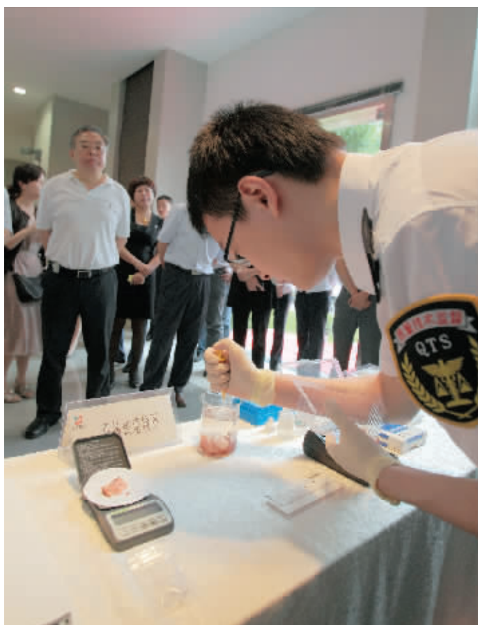
质检人员现场演示快速检测瘦肉精