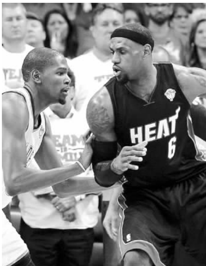
詹姆斯(右)与杜兰特正面交锋

昨天,热火队“梦幻三巨头”终于得以并肩首发,他们合砍72分,帮助球队以100:96战胜雷霆,把NBA总决赛的总比分扳成1:1平。詹姆斯独得32分,在对手地盘上放了一把大火,这也让雷霆当家球星杜兰特十分不爽,赛后向来脾气温和的阿杜罕见地爆了粗口。尽管被扳回一城,但这并不意味着雷霆就大势已去,18日,他们向热火的主场发起挑战。