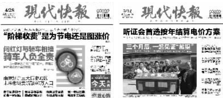
快报4月28日相关报道