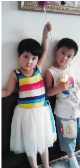
@ice6933:再来一张,妈妈让哥哥搂着我,他也不肯。哼!看我的~