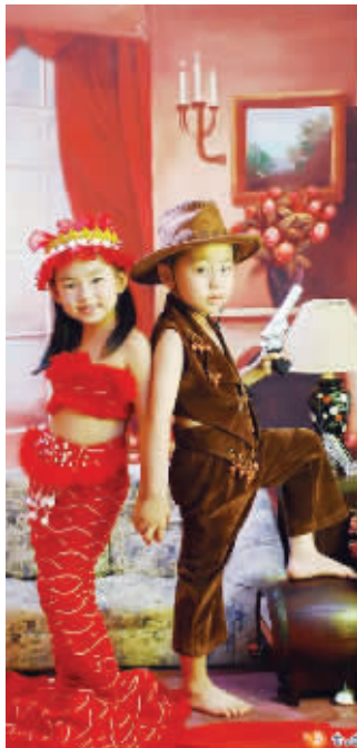
@1251号欣欣:昨天欣和天去拍写真了,发张美照让大家欣赏下,哈哈……