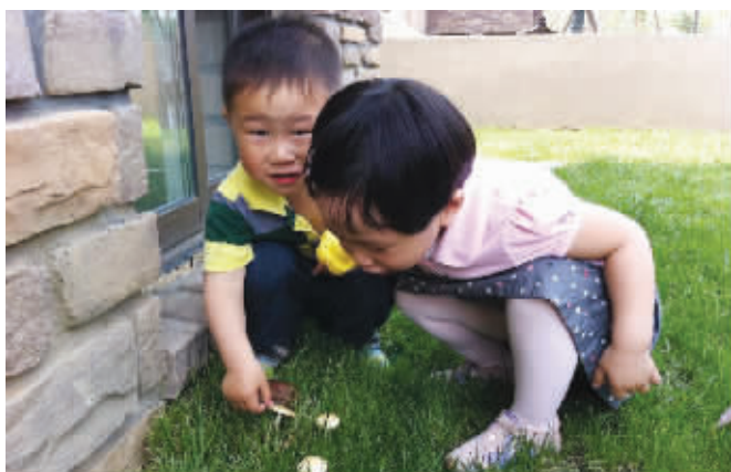
@柔情似水66:你先不要动,我来看看这蘑菇有没有毒。

3.获奖者看到获奖名单公布后即可前来快团客服领取奖品。(快团客服电话4006096060快团竞猜聊天群:166533110)