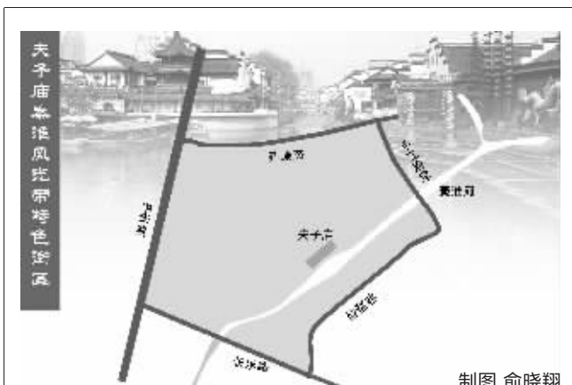
特色街区范围:东起平江府路(含平江府路两侧),北至建康路南侧,西至中华路(含中华路两侧),南至琵琶巷—来燕路—长乐路—钞库街,并包括东水关至中华门段内秦淮河(秦淮段)河道及两侧规划路(含规划路两侧)。

像是杂货市场,卖啥的都有。对此,办法要求,管理机构应当根据特色街区规划和功能布局,制定特色街区经营项目目录,经秦淮区人民政府批准后公布实施。经营项目目录批准前,应当向社会各界公开征求意见。对于已有经营项目不符合特色街区规划、功能布局和项目目录的,管理机构应当引导其调整或者迁出。