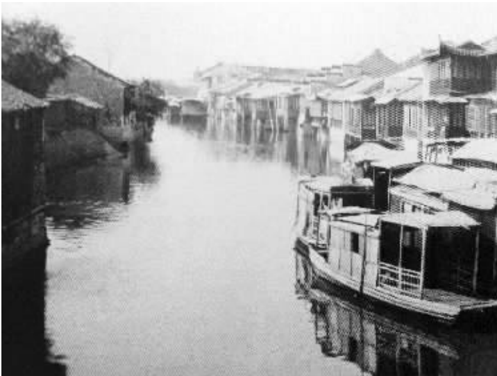
20世纪初的桃叶渡(翻拍)