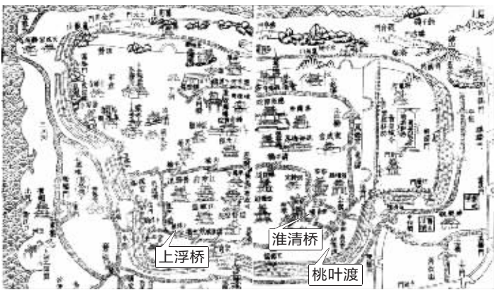
清代南京城地图 资料图片