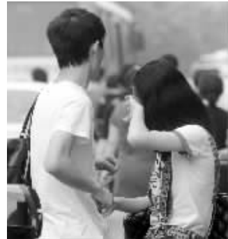
没考好,女生哭了

前一年,数学考试结束的时候,许多考生哭着走出了考场,因为觉得数学卷子很难。今年,还是有考生反映数学很难。