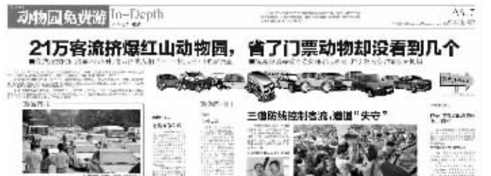
去年红山动物园免费开放, 一天客流超21万, 带来诸多问题 快报去年7月2日相关报道

熊猫馆还在闭馆期, 之前的两只大熊猫已经返回四川老家, 由于手续繁多复杂, “接班”熊猫什么时候来, 暂时不确定, 这次免费开放日, 市民肯定是无缘看到了。