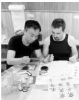
教队友练习书法 资料图片