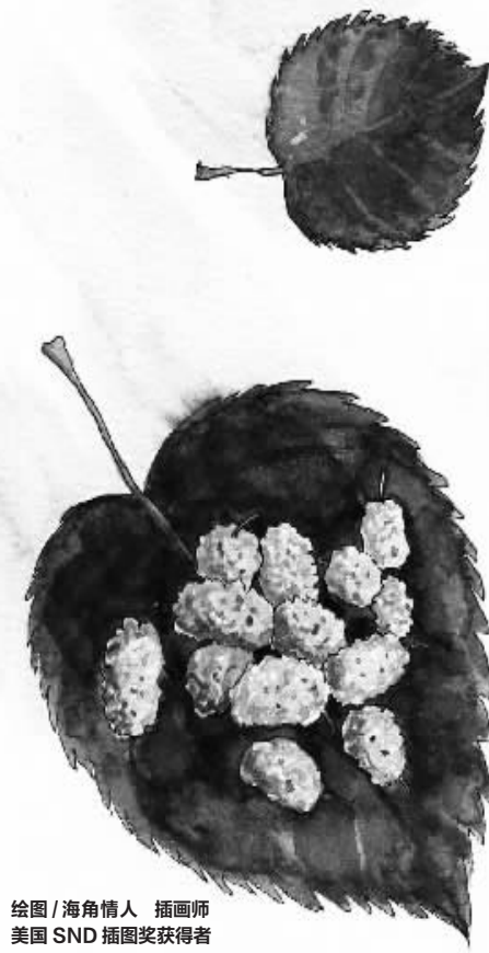
绘图/海角情人 插画师 美国 SND 插图奖获得者

简单粗暴有的时候就是一种美德,另外这招掌握起来更是容易得不得了,你只需要记住当姑娘问“你到底爱不爱我”的时候,你要做的就是直接把她按到墙上强吻她;当姑娘问“你会不会娶我”的时候,你要做的就是直接把她按到墙上强吻;甚至当姑娘问“我和你妈掉到河里你会先救谁”的时候,你要做的只是在心里默默骂上一句“你个脑残!”然后直接把她按到墙上强吻就好了。☹