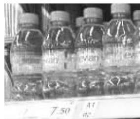
超市里330毫升的依云矿泉水售价7.5元

矿泉水协会这位专业人士分析,这批依云矿泉水被检出亚硝酸盐超标,可能有如下几个原因:矿泉水在处理过程中用臭氧消毒,一旦有残留未及时发现清除,可能与矿泉水中的硝酸盐成分发生化学反应,生成亚硝酸盐;水源地遭到了污染;另外,矿泉水的品质还受物流、仓储环境等因素的影响。他表示,这些只是猜测,具体原因还有待查明。