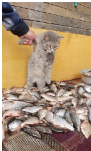
主人,我只是想多看一眼