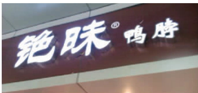
不仔细看还真被忽悠了