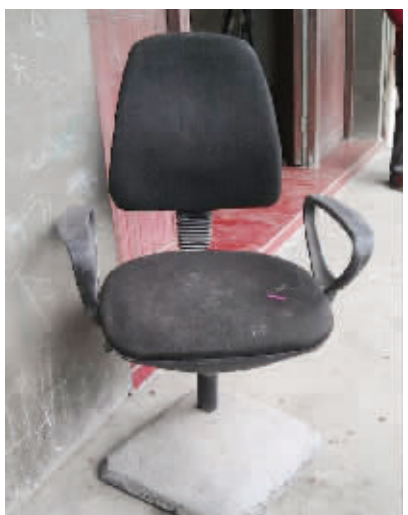
底盘结实,坐着稳当