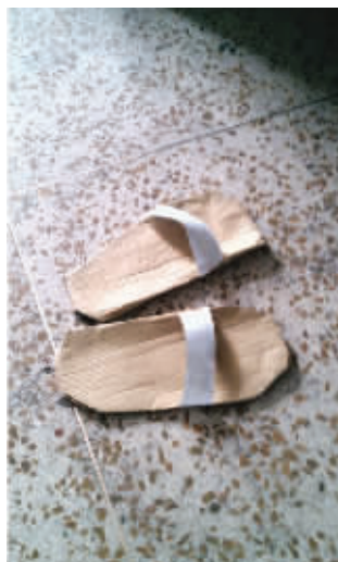
无聊粘了一双拖鞋,换来班主任心痛的眼神