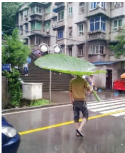
今年夏天,哥撑着它去看海