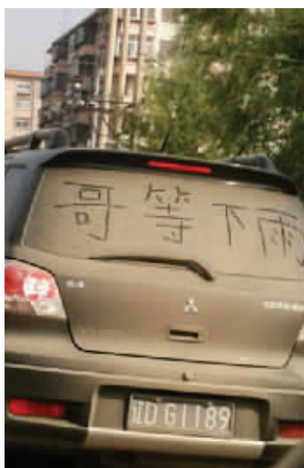
传说中的靠天洗车族