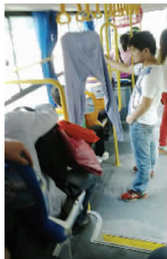
夏天到了,秋裤是该脱了