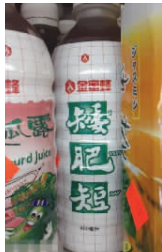
这是“矮穷丑”的专用饮料吗?