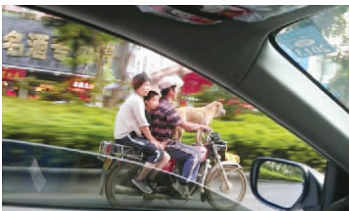
瞧这一家四口的幸福生活