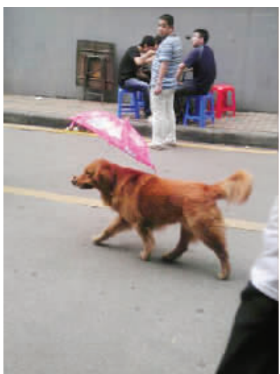
世界肿么了,狗都会自己打伞了