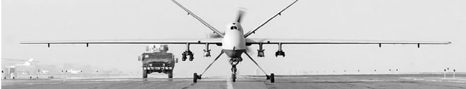
美国“捕食者”无人机 资料图片