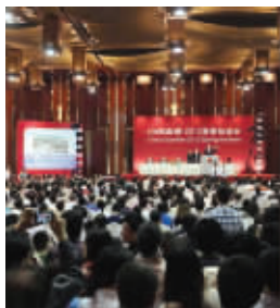
中国嘉德2012春拍现场