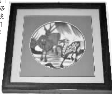
古瓷片打造的工艺品