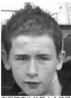
在医院丧生的第六个孩子