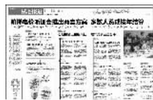
快报5月12日相关报道

在昨天的新闻通气会上,记者曾询问为何选择在6月1日开始调价,物价部门相关负责人表示并没有特别的考虑。