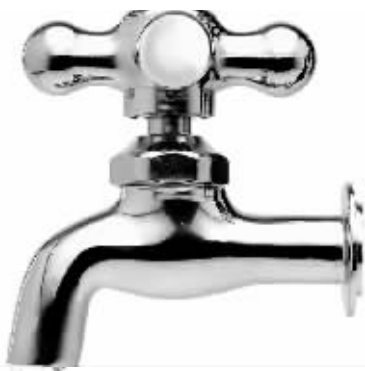
居民生活用水分档 (针对一户一表、抄表到户)