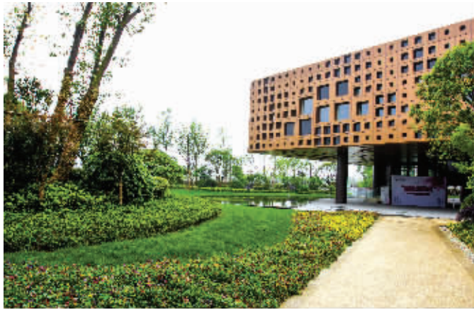
品质科技盘团购备受关注

果然,开盘当天7点不到,众多客户已提前赶到项目现场,售楼处内人头攒动,闹如街市,大家唯恐心仪已久的房子花落谁家,忙碌的置业顾问甚至连喝水的时间也没有。爆棚的人气很快点燃客户积蓄已久的热情,纷纷出手,销控表上标示的房源逐个屋归其主,稍有迟疑的客户只能眼睁睁地看着心爱的房子归于别人名下。团购房源甚至一度售罄,项目销售团队当机立断,以团购价紧急加推2号楼部分精品房源作为回馈,让愁眉不展的客户笑逐颜开,圆了他们一个绿色低碳生活的愿景。六个字足以形容这不可思议的一天:开盘,售罄,加推。