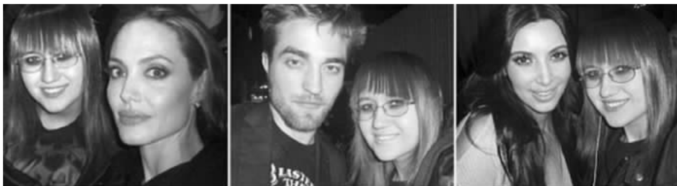
从左到右:安吉丽娜·朱莉、罗伯特·帕丁森、金·卡戴珊

毕业礼物有哪些?约58%的人表示会送现金,40%多一点的人表示会送卡片,更多的人会送更贵一些的礼物。送衣服、电子产品、卡片的人的比例已恢复甚至超越了经济衰退前的水平。现代快报记者 李欣 编译