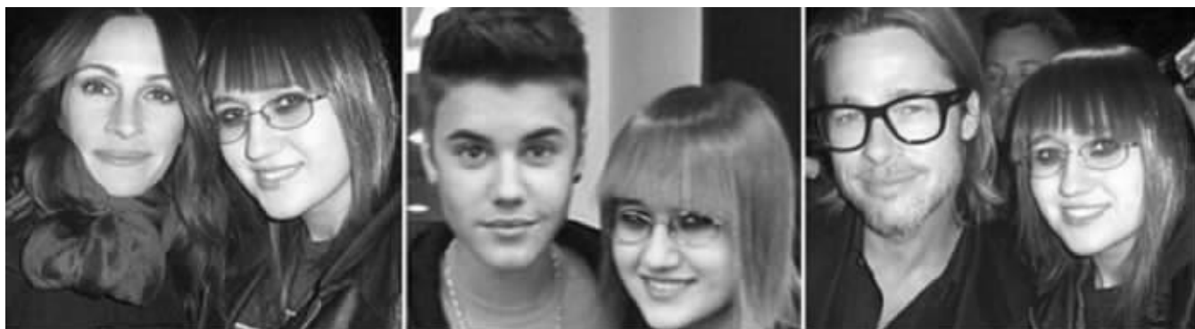
从左到右:茱莉亚·罗伯茨、贾斯汀·比伯、布拉德·皮特