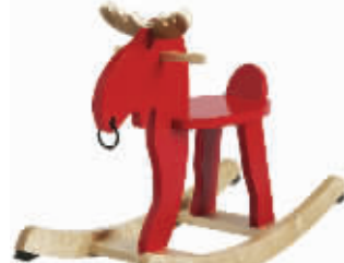
摇摆驼鹿活动价249元