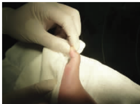
麻醉中拇指仍不能伸直