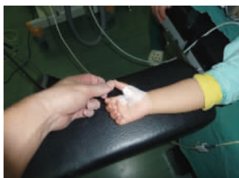
针刀治疗后拇指伸直

术名: 针刀松解术 患儿: 2岁2个月 症状: 双拇指不能伸直大半年 诊断: 双拇指先天性屈指肌腱鞘炎