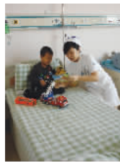
儿童心理护理服务