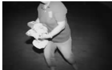
女孩遗留在岸上的鞋子

出事的女孩今年18周岁,据了解,女孩并不会游泳。据称,当时她看到两个同伴游泳之后,也脱掉了鞋子,准备到江边玩水。记者现场也看到,江堤坡度有三四十度,从上到下有六七米长,“女孩第一次下去时,就站不稳滑了下去,被其他人拽住了。”知情者称,但是第二次她又尝试,结果这一次,她又滑下去,一下子掉到江水里就不见了。