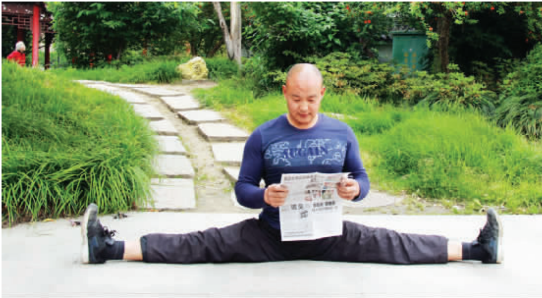
晨练加晨念,一举两得,高手在民间啊! 5月22日摄 (作者张远岩获30元话费)