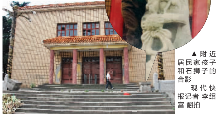
两个石狮子被偷,只剩下基座