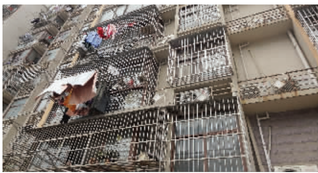
在这幢楼撬门入室