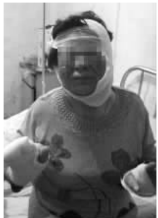
大多数入头部和手部受伤

昨天,有网友发帖称,淮安市涟水县军民中心村一家饭店火锅发生爆炸,事故导致17人受伤,其中3人重伤。伤者被送到涟水县化工医院治疗。