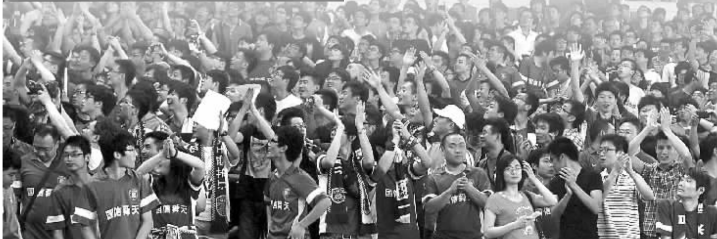
舜天俱乐部提醒球迷,应在官方销售点购买球票