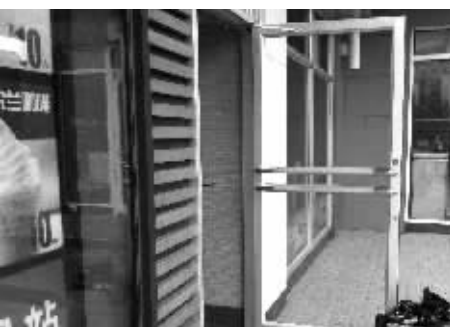
损坏的玻璃已被换下

①记者 李绍富:昨天下午,汉中门肯德基店附近,随着“啪啦”一声响传来,该店西侧玻璃门的玻璃龟裂,还留下了一个类似弹孔的小孔。这扇小门位于肯德基店西侧,民警在门附近未发现钢珠或是子弹。附近一带比较空旷,门西侧无建筑可供射击玻璃门。警方初步断定,可能是有人近距离用玩具枪发射弹珠类物品所致,所幸无人受伤。目前,此事仍在进一步调查中。