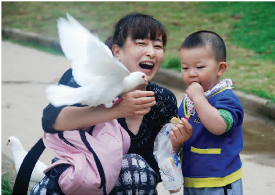
妈妈揪了点面包给宝宝喂鸽子,可宝宝抓起来却送进了自己的嘴巴,孩子的小心思果然很简单。5月20日摄于音乐台