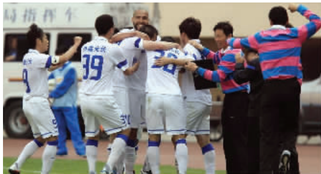
收到对方守门员送上的“大礼”，舜天队员兴奋不已

昨天下午，经历了两连败的舜天客场1:1艰难战平大连阿尔滨。比赛中，戏剧性的场面层出不穷，堪称中超史上的经典之战。先是阿尔滨门将送礼，让达纳赫破门得手，紧接着，球迷脚端边裁。赛后，阿尔滨主帅觉得舜天的这颗进球实在不可思议。