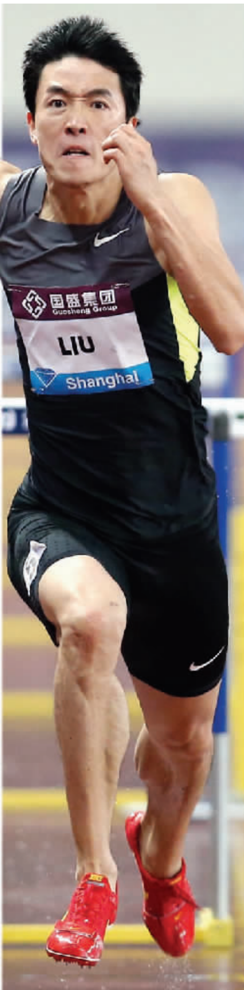
刘翔全力冲刺

刘翔12秒97的成绩意味着什么？也许央视解说员杨健的话最有代表性：“这是刘翔2008年之后重返巅峰，创造了今年这个项目的最好成绩，在这样湿滑的场地上，12秒97，简直不可思议！见证传奇——今年赛会的口号实在太贴切了，刘翔剑指伦敦。”2007年后再次跑进13秒，刘翔的伦敦奥运会前景，非常光明。