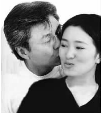
巩俐和前夫黄和祥