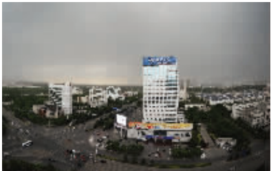
乌云笼罩的宿迁