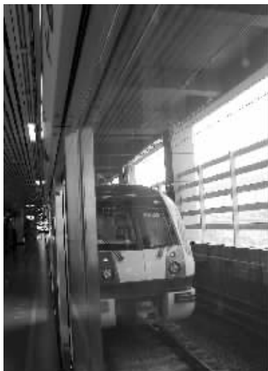
即将大修的金马路站