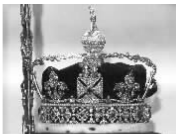
镶在权杖和王冠上的最大两颗钻石