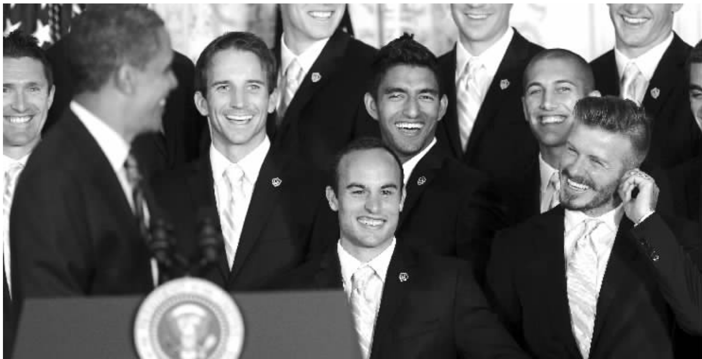
奥巴马的调侃引来现场一阵哄堂大笑