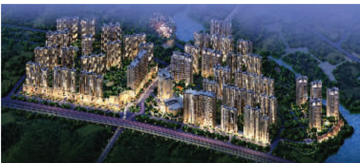
南京凤凰城夜景鸟瞰图