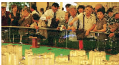
上周日数千名南京人涌向凤凰城

碧桂园·凤凰城到底有什么不同?这是不少买房人首先提出的疑问。而回答这个问题,任何的主观判断都显得十分苍白无力,事实上,南京的百万大盘甚至更大体量的超级大盘其实也并不在少数,由于亲历过南京楼市的黄金十年,他们只需以产品或是以配套就很快形成了自己的市场号召力,在他们看来,其实不存在什么转型与创新,一条地铁的规划利好或是配建一座几万m 2 的商业中心就能解决业主的绝大多数生活问题。或许也正因如此,当今年碧桂园·凤凰城重新绽放在南京市民前,不少业内人士惊呼,碧桂园给南京不少的大盘好好上了一课,放眼社区拥有五星级标准酒店、近25万m 2 的园林美景、约16万m 2 商业中心、IB国际学校(计划引进)、业主专享楼巴……放在南京,拥有以上任何一项资源就已经非常难得,而在碧桂园·凤凰城这四大顶级资源竟然悉数汇集,南京众多大盘,这样的手笔可谓绝无仅有。