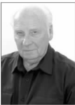
退休警官林登·拉菲提日前出版了新书《十二宫杀手隐蔽》

杀手真相 连环谋杀37人, 杀人后向警方写信炫耀 全美“最大凶杀悬案” 水落石出