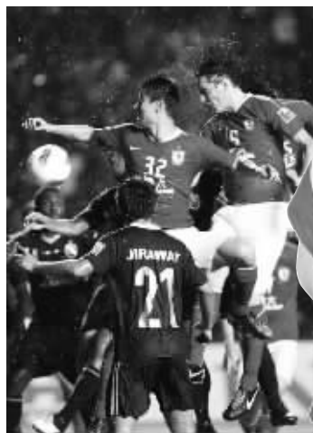
雨战让恒大很不适应

昨晚,亚冠联赛小组赛最后一轮,广州恒大只有在客场战胜泰国球队武里南联,才能获得出线权,结果第90分钟,孔卡罚进制胜点球,2:1!广州恒大力克武里南联,以小组头名身份晋级亚冠联赛16强。值得一提的是,这场胜利让球队收获了1400万元的巨额奖金。