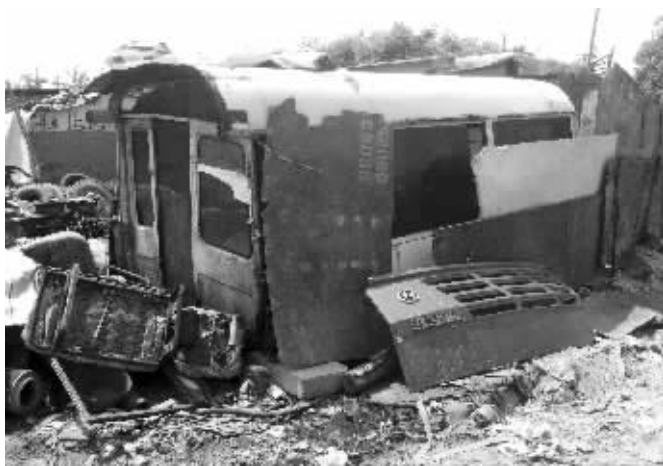
收废品者就住在车厢里

随着夏天临近, 现代快报接到的环境“脏、乱、差”投诉越来越多。昨日, 快报记者兵分多路, 分别走访惠山二茅峰、崇安寺附近、钱桥地区, 发现问题真不少。亲, 你身边如有不卫生现象请反映给我们, 快报记者将第一时间到场了解情况。电话: 82756337, 电邮: xdkbwz@163.com。