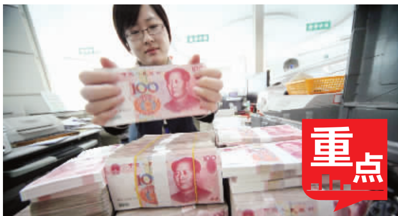
央行再次降准,专家普遍认为利好股市

中国人民银行12日决定自5月18日起,下调存款类金融机构人民币存款准备金率0.5个百分点。