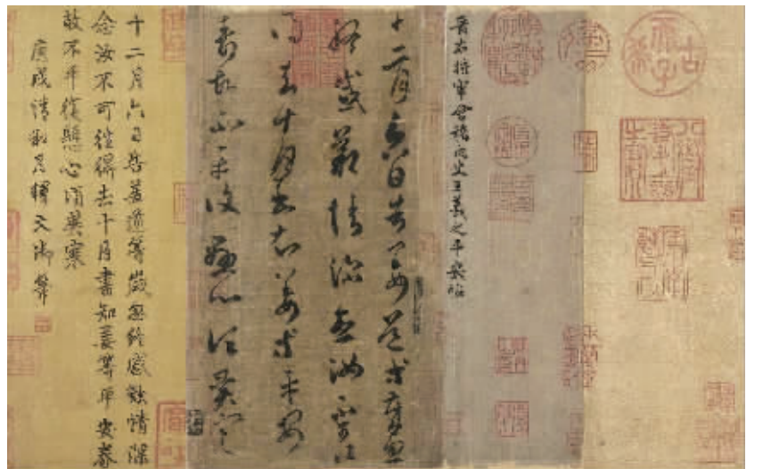
海外征集：王羲之摹本《平安帖》3.08亿元成交