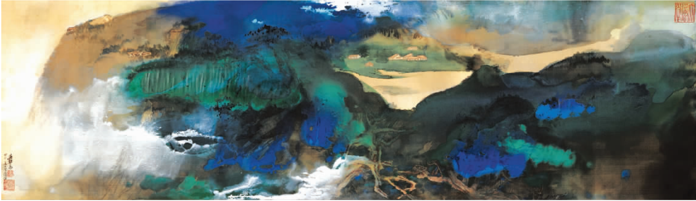
海外回流：张大干《爱痕湖》以1.008亿成交

现代快报 A28、A29 2012.5.12 星期六 责任编辑 柳林 主编 时芸 组版 徐杨