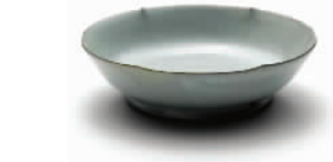
海外回流：“北宋汝窑天青釉葵花洗”以2.0786亿港元成交