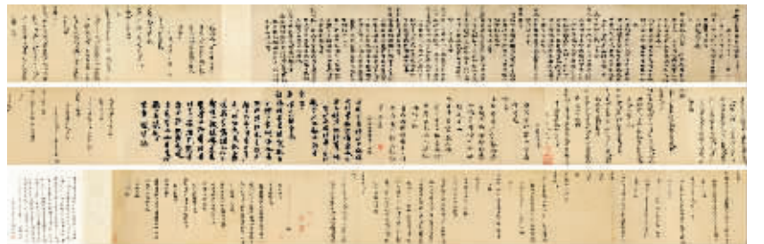
美国回流：元人《崇真万寿宫瑞鹤诗唱和卷》以1.01亿元落槌

此次查税风波之后，对于海外征集业务，相关拍卖公司负责人表示“作为拍卖行，此时只能静观事态走向，如果今后每一件海外拍品都要按照23%的税率缴税的话，这种业务模式就要死了”。