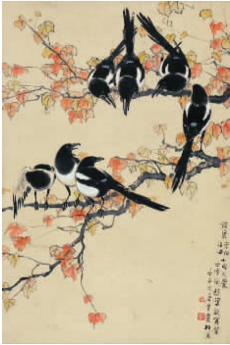
美国征集：即将拍卖的徐德鸿《七喜图》