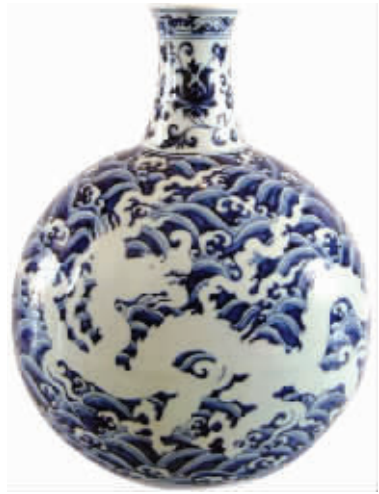
海外回流：“明宣德青花海水白龙纹扁瓶”拍出2.24亿元