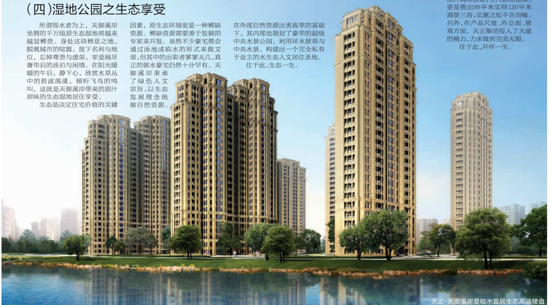
天正·天御溪岸是临水宜居生态高端楼盘

四周，舒适的户型设计创造“高档、休闲、健康、自然”的生活方式。全系产品户型设计合理，90平米的两房、120-140平米的三房、150平米以上的四房，值得一提的是，户型赠送面积多，10多平米的人户花园堪称标配，让产品的附加值在不经意间显著提升，让生活变得更加开阔和惬意，五月新品加推，更是推出99平米实得120平米湖景三房，实惠之处不言而喻。另外，在产品尺度、外立面、景观方面，天正集团投入了大量的精力，力求做到完美无瑕。住于此，开怀一生。