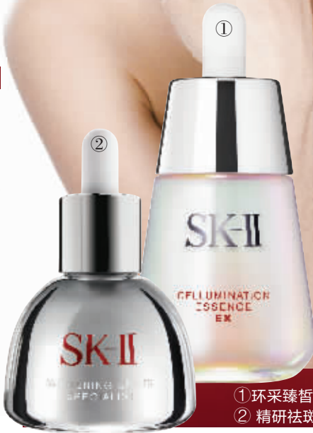
① 环采臻皙光感精华露 ② 精研祛斑精华液