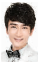
美肌达人 ——小新老师

创新科技绽放美白新境界—动人的光感神韵源于肤色和肤质在微观层面上的均匀,而压力受体的过度活跃则会导致皮肤细微的肤色不均.SK-II全新环采臻皙光感系列采用的复合配方 Aura-Bright Cocktail可以在细胞层精准重塑肌肤“像素”,缔造神采照人的光感肌肤。