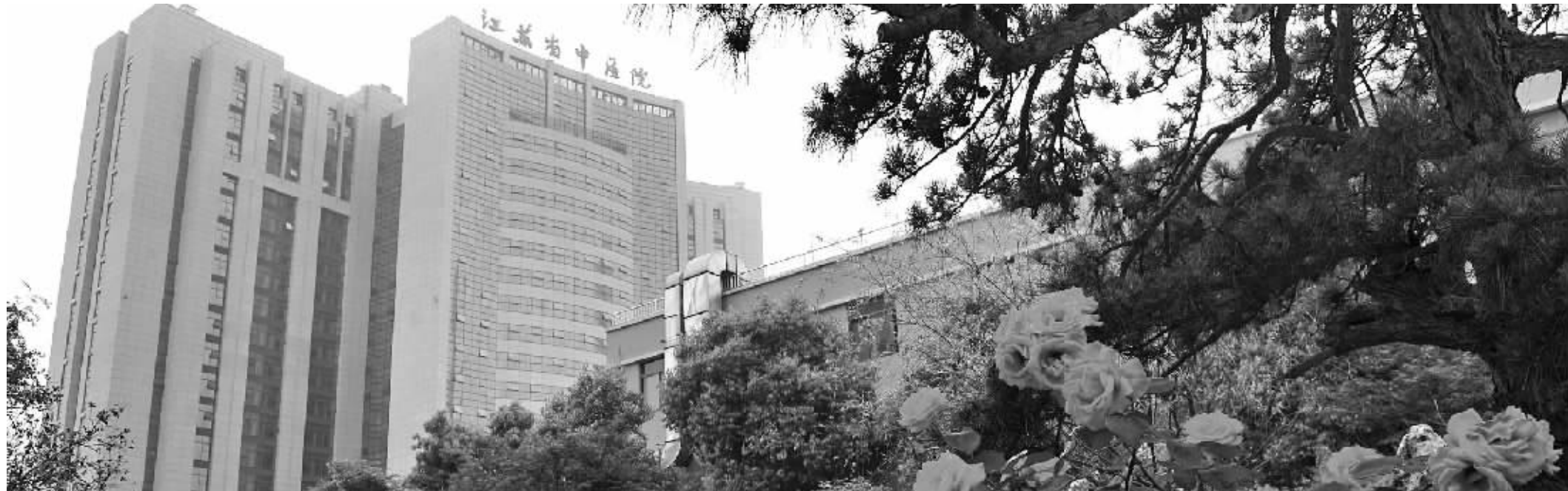
省中医院南院今天正式启用,和本院一街之隔

床位数的增加、门诊的扩张,直接带来的就是人员的紧缺。院方表示,为了缓解医护人员的压力,医院开始全面“招兵买马”。