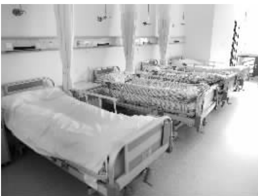
省中医院南院病房

穿过园林式花园,就是省中新建成的医疗综合楼。据省中医院院长刘沈林介绍,2004年10月,南扩工程经省政府批准立项,新建的南院相当于再建了一个半省中医院。医疗综合楼第4层,设有14间国际一流的手术室,加上原有的10间手术室,医院每天可以进行上百台手术;4层以上为标准病房,共开设1600多张床位,本院原有床位为1100张,后削减了部分,这样扩建之后医院床位总数增加到2500张,病区增加到56个,可容纳更多的患者住院。