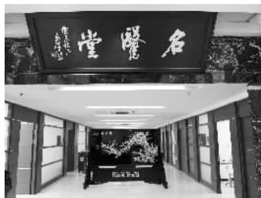
省中医院名医堂诊室增加

到江苏省中医院看过病的人,都会有一个感受:人太多了,挂号、排队、拿药样样都觉得拥挤。昨天,记者来到新扩建的门诊大楼,正中央是门诊总服务台,如果你不知道医保政策或自己的病应该看哪个科室,在总服务台,能在最短的时间内得到答案。此外,医院为了缩短收费和病人取药的时间,七层楼中,挂号、收费等窗口将增至42个。