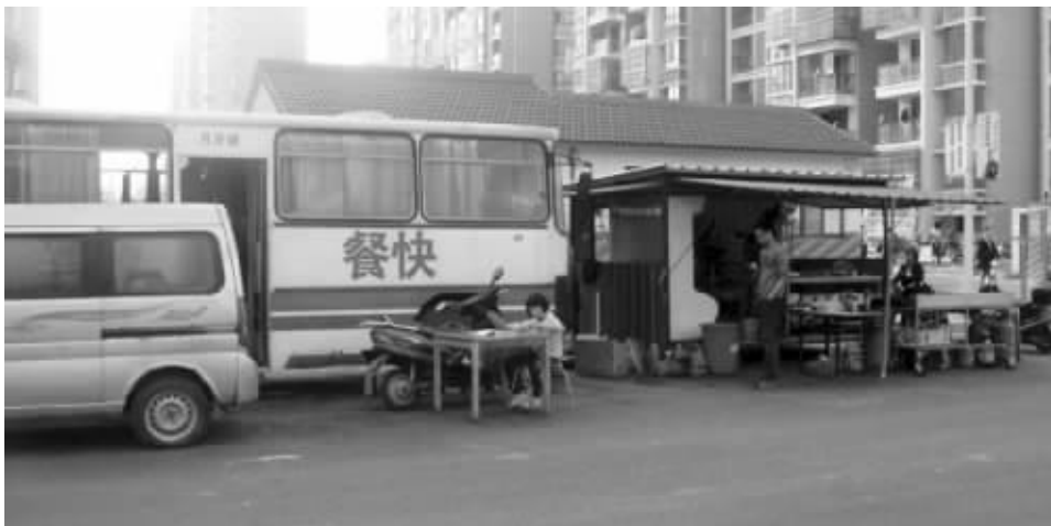
大巴车改装成流动餐车

5月8日下午4点,滨湖城管执法大队出动执法人员30余人,执法车辆4辆,对位于胡埭镇富润花园小区门口的4处占道大型流动夜宵车进行了强制拖离,同时当天被取缔的还有几辆改装成流动餐饮车辆的客运大巴车。