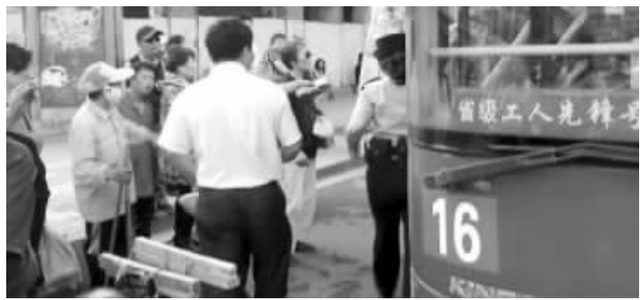
两男子闹事时,引来路人围观