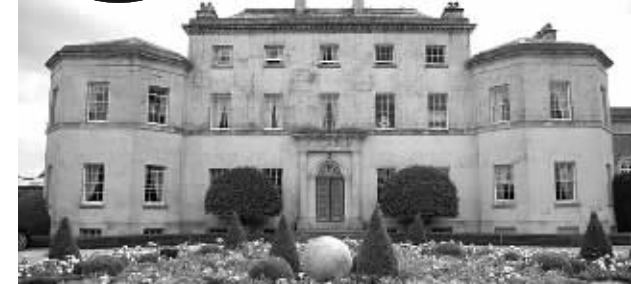
费莉希蒂·劳登和她价值3000万英镑的豪宅

据英国《每日邮报》报道 英国吉百利糖果公司62岁的女继承人费莉希蒂·劳登不满自己的家族企业被美国卡夫食品公司收购,为了成立一家新的巧克力公司与之抗衡,劳登卖掉了自己价值3000万英镑的豪宅。