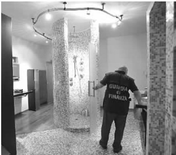
浴室贴满了小块的蓝白格子瓷砖