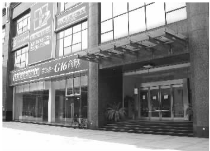
南京邦家办公楼人去楼空