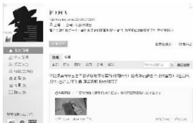
炒作者在微博上自称小偷吸引眼球 微博截图