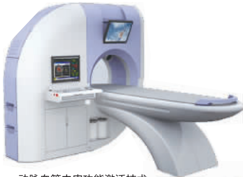
动脉血管内皮功能激活技术