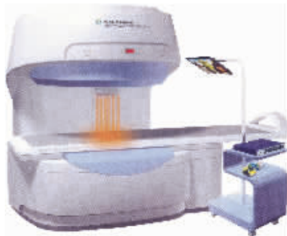
无极光聚集场系统