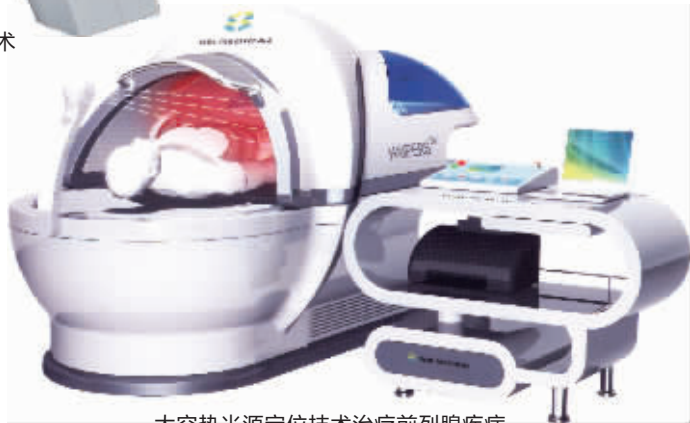
太空热光源定位技术治疗前列腺疾病

近年来,南京建国男科医院引进了一批国际上高端的男科检查设备和治疗仪器,它们时时刻刻为患者的精确诊疗保驾护航。